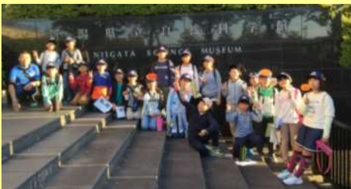
自然科学館の前で記念写真！