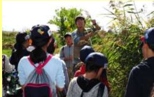
福島潟で、レンジャーさんに茅(かや)の説明を受けました。

▼10月15日(土)～16日(日)の2日間、新潟市にタウン研修に行きました。▼一日目は、まずビュー福島潟へ行き、潟の歴史や潟に生きる植物・生物について勉強。その後、県立自然科学館で、科学の不思議を体験しました。▼夜にはナイト活動ということで、メディアシップまで歩き夜景を見学！高層ビルからの眺めは最高でした♪▼二日目は、万代方面を自由散策！初めて駅前を散策する4年生はドキドキです！！どの班も、それぞれが行きたい場所へ行き、無事に買い物などを楽しむことができました。